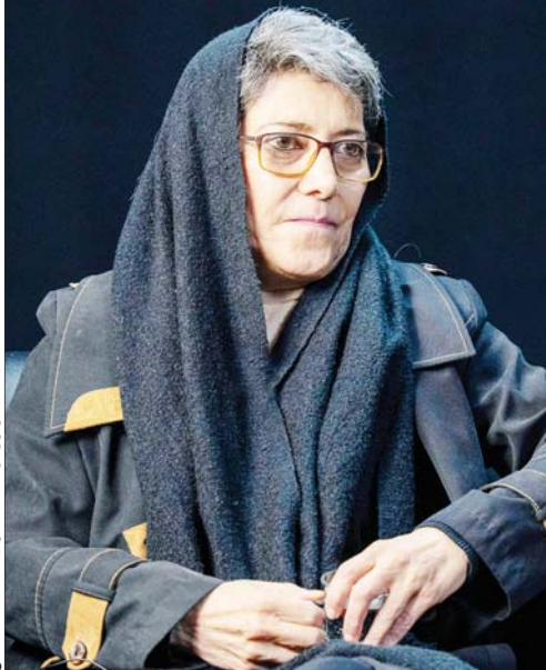
این گفت‌وگو را در صفحه ۹ بخوانید.