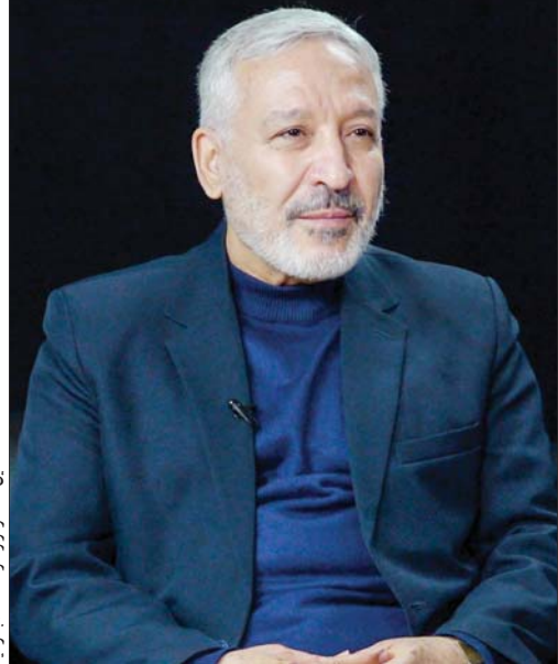
این گفت‌وگو را در صفحه ۶ بخوانید

دیدار نتانیاها و ترامپ در گفت‌وگو با محمد ایرانی