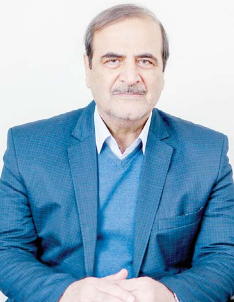
این گفت‌وگو را در صفحه ۲ بخوانید.

گفت‌وگو با رویا افشار در حواشی فیلم «اشک هور»