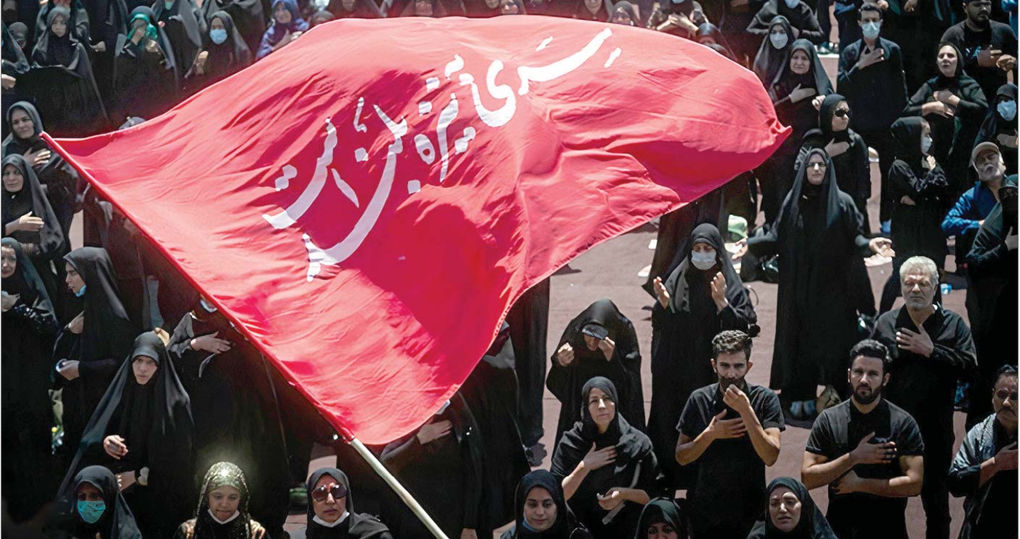
حکم طالبان نشین

به رسم همیشگی در این روزها نام حسین (ع) و یارانش طنین‌انداز می‌شود و آدمیان بسیاری از کرامت او لبریز می‌شوند. گویی محرم و در لوی آن تاسوعا، عاشورا و دلدادگی‌های بی‌همتایش قراری بزرگ برای تجمع آدم‌ها در کنار هم و پرداختن به واقعیت‌هایی هستند که در قلب حسین (ع) چون نور می‌درخشیدند. عدالت و آزادگی بی‌شک عصاره‌ای از وجود بی‌همتای حسین (ع) محسوب می‌شوند و علت‌هایی که خورشید کربلا را ساختند. در این همه‌مه عاشقی باشد که آزادگی و حریت لحظه‌ای رهاییمان نکند و به نام حسین (ع) قلبمان را مملو از عدالت و آزادگی کنیم.