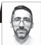
صاحج نقره‌کار وکیل دادگستری

۱- اولین رنجی که در کشور می‌بریم، اسراف سرمایه انسانی است. اگر استعدادها و مغزها درست و بجا تحویل گرفته شود و افراد مستعد و دانا و نخبان منزلت سزاوار داشته باشند، نظام حل بحران در کشور کارآمدتر خواهد بود. استعدادهای ضعیف یا کم، موجد و مولد بحران هستند و اگر این ظرفیت را در تساب‌آوری نقد ناصحان و مناصحت خیرخواهان نداشته باشیم، در بر پاشنه ندانم‌کاری‌ها می‌چرخد و کشور و مردم خسارت مستمر و تاوان انباشته می‌چسند. فرهنگ و اخلاق تحمل مخالف و منتقد را نهادینه کنیم. ۲- آن‌گاه که آزادی بیان و پس از بیان در دانشگاه‌ها فرین هزینه باشد، دو اتفاق می‌افتد؛ یا نخبان ترک دانشگاه می‌کنند و مهاجرت را برقرار راجع می‌دانند، چنانچه امروز با فاجعه‌ای چنین سترگ مواجهیم یا سکوت پیشه کرده و انزوا را برمی‌گزینند. قدرت عمومی نباید برای دانشگاه هم آهنگ نظارت استصوابی و حذف سیاسی بنوازد. بازتاب اخراج استادان یا بازنشستگی اجباری، ترک مناصحت دلسوزان و نقض حقوق بشر و حق مردم خواهد بود. به پیامد نقض حق شهروندان بیندیشیم. ۳- تحقق دنیایی که در آن افراد بشر در بیان عقیده آزاد و از ترس، فارغ باشند، آرمانی است که مستلزم مراقبت مسئولانه، مطالبه مستمر و تضمین مؤثر است. تکثر و تنوع اندیشه‌ها ضامن پویایی و نشانه حیات اجتماعی است. خرد انتقادی مبنای توسعه و تغییر بر مدار مقتضای زمانه است. آزادی بیان معیاری اساسی برای جامعه چندصدایی و دموکراتیک قلمداد و نقض این آزادی همواره به تضییع و تعلیق نقض مصادیق حقوق بشر و آزادی‌های