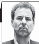
جلال میرزایی نماینده مجلس دهم

و بیشتری در مقایسه با آن سال‌ها به بار آورد. مروری بر موضع‌گیری‌هایی که این روزها مقامات دولتی و غیردولتی در ارتباط با صدور قطع‌نامه شورای حکام داشته‌اند، از جهاتی نگران‌کننده است و نشان می‌دهد در مواجهه با تهدید به‌وجودآمده، برنامه و راهکار مشخصی ندارند تا بر اساس آن تدابیری جهت تأمین منافع کشور اتخاذ کنند.