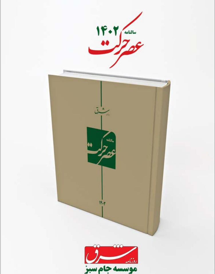
موسسه جام سبز

الگوی داده-ستانده به دلیل در نظر گرفتن روابط بین‌فعالیت‌ها از الگوهای اقتصادی مورد استفاده دیرباز کشورها و مناطق و جهان برای تحلیل و برنامه‌ریزی است. امروزه بنا به نظر محققان برجسته بین‌المللی، عملکرد دانشگاه‌ها و مؤسسات بین‌المللی و پیشرفت فناوری اطلاعات ترکیب روش‌های مختلف الگوسازی به دلیل رفع محدودیت‌ها با گسترش نقاط قوت الگوها یک ضرورت در اقتصاد محسوب می‌شود و سابقه طولانی دارد. منظور از الگوی ترکیبی الگوی است که دارای بیش از یک فرایند و روش‌شناسی اصلی در الگوسازی را در نظر دارد. «کلان» برنده جایزه نوبل اقتصاد مطرح کرده است که چنین الگوهای ترکیبی می‌تواند یک «الگوی بنیادین جدید» برای راهنمایی ما درباره عملکرد اقتصاد به عنوان یک کل باشند. انگیزه اصلی الگوهای ترکیبی شامل دغدغه‌های نظری، دغدغه‌های کاربردی، قابلیت پیش‌بینی بهتر، قابلیت بهتر و کامل‌تر تحلیل، دغدغه‌های مربوط به خطای اندازه‌گیری بوده و هست. در این زمینه در ایران، فقر مطالعه به لحاظ نظری و کاربردی برخلاف کشورهای توسعه‌یافته زیاد است. در کشورهای توسعه‌یافته دانشگاه‌ها و پژوهشگاه‌های مختلف با تکرش و روش‌شناسی حاکم بر خود اقدام به طراحی الگوهای جهانی و بین‌کشوری به منظور رفع نیازهای تحلیلی و برنامه‌ریزی می‌کنند و به مرور زمان آنها را توسعه و گسترش داده و تکمیل کرده‌اند و این موضوعی است که در دانشگاه‌ها و پژوهشگاه‌های ایران و جاهت علمی لازم را پیدا کرده است. در این باره در حوزه برنامه‌ریزی و تحلیل اقتصادی الگوهای متعددی در مؤسسات علمی دنیا طراحی و تکمیل شده و می‌شود که می‌توان به برخی از آنها مثل الگوهای اینفورم دانشگاه مریلند، الگوی لیفت، الگوی رمی، الگوی