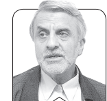
سیدمصطفی هاشمی طباطبائی

می گویند گوبلز، وزیر تبلیغات هیتلر، گفته است دروغ باید آن قدر بزرگ باشد که آن را مردم دروغ نشمرند. ما هم دروغ هایی شبیه به این توصیف داشته ایم؛ مانند معجزه هزاره سوم، هاله نور، تولید اتم در زیرزمین با دیگ زودپز و بسیاری دیگر که اگر در همان لحظه دروغ آن را برخی نفهمیدند، بالاخره بر آن کوس رسوایی زدند. این یک نوع دروغ است اما دروغ هایی هم هست که مفهوم و معنی آن را به آینده حواله می دهند و در مقطع زمان بیان قابل راستی آزمایی نیست و اگر هم بعدا راست درنیاید، می گویند گفتیم ان شاء الله.