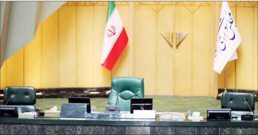
جلسهٔ هیئت‌رئیس مجلس شورای اسلامی

گزارشی از رویارویی طیف‌های مختلف اصولگرایی برای تصاحب کرسی ریاست مجلس