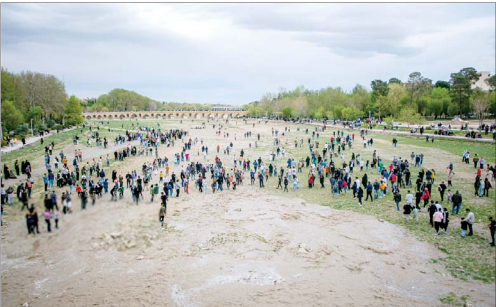
جریان آب «راندن‌درو» پس از ماه‌ها خشکی، به‌طور موقت برقرار شد. این اقدام با هدف حمایت از کشاوران، کاهش اثرات خشکسالی و تأمین نیازهای زیست‌محیطی منطقه انجام شده است. از نخستین ساعات جاری‌شدن آب، شمار زیادی از شهروندان و گردشگران در کنار رودخانه و پل‌های تاریخی اصفهان حضور یافتند تا لحظه‌ی بازگشت آب را نظاره کنند.