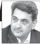
بیروز حناچی شهردار سابق تهران

مخلص کلام «عبور از قانون، ایجاد رانت می‌کند و رانت به بحران ختم می‌شود» و البته درد وقتی بیشتر می‌شود که برخی افراد از قانون لازم‌الاجرا مستثنا هستند. این اتفاق ممکن است برای کسانی که سرمایه و ارتباطات بیشتری دارند، به‌راحتی رخ دهد؛ نمونه‌اش متروپل آبادان.