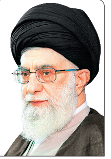
پیام مقام معظم رهبری به انجمن‌های اسلامی دانشجویان در اروپا