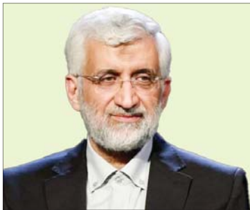
گزارش تیتریک را در صفحه ۴ بخوانید