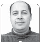
ادامه‌در صفحه ۳