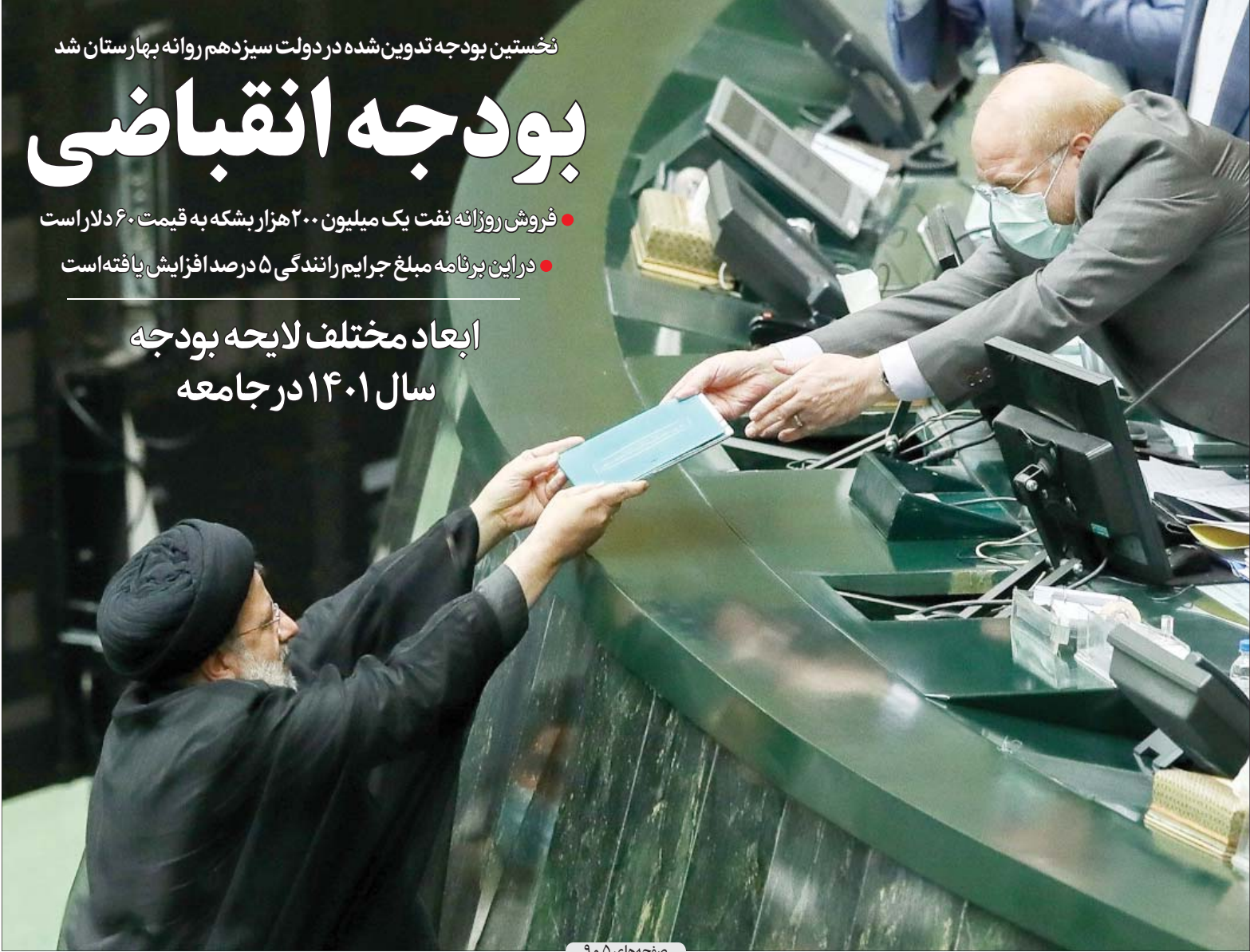
صفحه‌های ۵ و ۹

نخستین بودجه تدوین شده در دولت سیزدهم روانه بهارستان شد