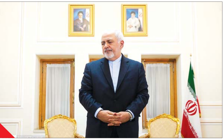
عکس، صیدو توپکلی، فرانس

پیش‌تر اعلام شده بود سفر ظریف به مذاکرات برجامی مربوط نبوده است