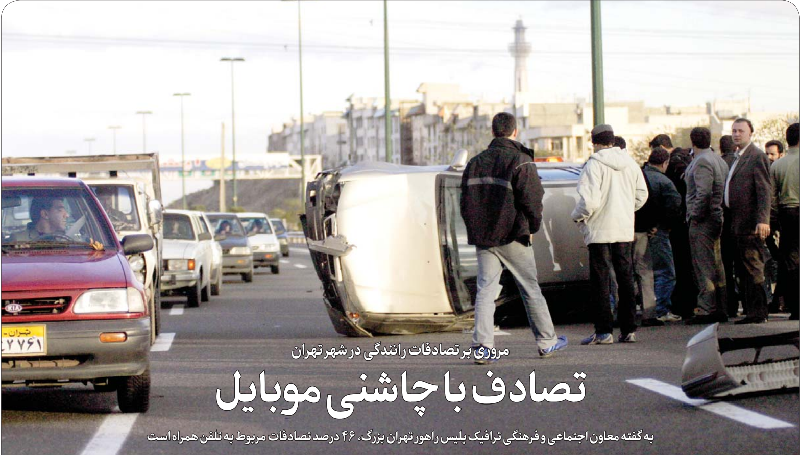
در صفحه ۲ بخوانید