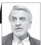
سیدمصطفی هاشمی طباطبائی