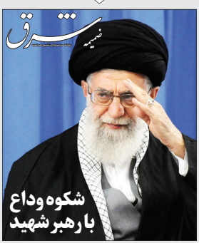
شکوه وداع بارهبر شهید

ضمیمه امروز روزنامه شرق را از روزنامه فروشی‌ها بخواهید