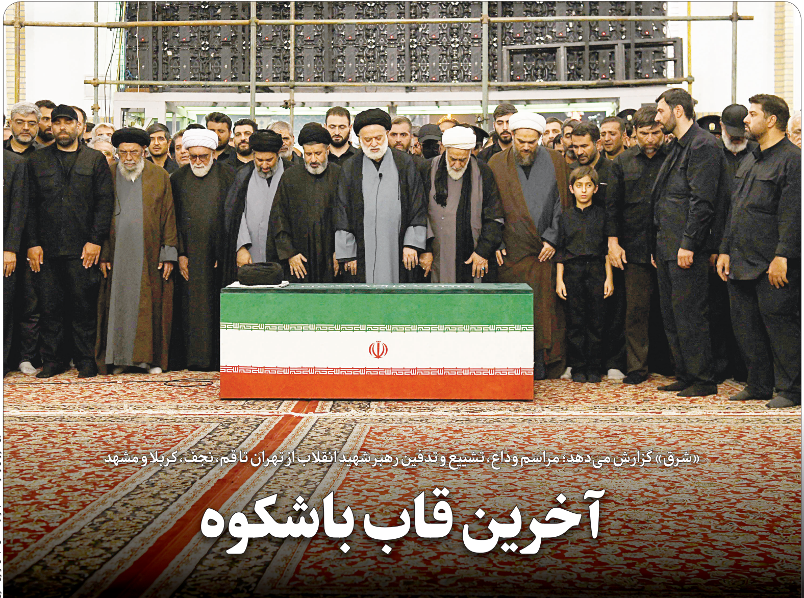
این گزارش را در صفحه ۲ بخوانید.

پس از جنگ ۱۲ روزه و جنگ رمضان، مناسبات ایران و آمریکا دچار تغییری گسترده شد. آمریکا دریافت که نمی‌توان ایران را در چارچوب الگوهایی دید که پیش‌تر در آنها مداخله کرده بود؛ برای ایران نیز این تجربه روشن کرد که ابزارهای لازم برای جلوگیری از تحمیل پاسخ‌کوئی و ایجاد قدرت چانه‌زنی را در اختیار دارد. با این حال مسئله اصلی همچنان باقی است: آیا این قدرت می‌تواند به توافقی پایدار و به دستاوردی سیاسی تبدیل شود؟ بنابراین این رابطه دیگر در چارچوب قدیمی «نه جنگ، نه صلح» توضیح‌دانی نیست. آن وضعیت بر بازدارندگی، تهدید و برهیز دو طرف از ورود به جنگ مستقیم استوار بود؛ اما اکنون جنگ از سطح احتمال عبور کرده و به تجربه‌ای تکرار شونده تبدیل شده است. مذاکره ادامه دارد، اما هم‌زمان حمله نیز رخ می‌دهد؛ آتش‌بس برقرار می‌شود، اما هیچ سازوکار مطمئنی برای جلوگیری از شکست آن وجود ندارد؛ خاک ایران هدف قرار می‌گیرد و ایران نیز پایگاه‌های نظامی آمریکا در منطقه را هدف قرار می‌دهد.