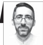
سالج نقره‌کار وکیل دادگستری

کمیته صیانت از حقوق مردم به ابتکار ستاد حقوق بشر قوه قضائیه تشکیل شد. نخستین جلسه آن هفته جاری با حضور مسئولان سه قوه و نمایندگان ۲۹ دستگاه حکومتی برگزار شد. بنده به نمایندگی کانون وکلای دادگستری در جلسه حاضر بودم و عزم داشتم به نیابت از نهادهای مدنی و مستقل کشور، سخنانی بگویم تا صدای بی‌صدایان جمع باشم و مصداقی از کلام نبوی شوم که جامعه آن‌گاه مقدس است که حق ضعیف از قوی بی‌لگنت گرفته شود. اگر قرار باشد این کمیته حقوق مردم، واقعا حرکتی برای استیفای حقوق مردم کند اول از همه باید کلیشه‌های تصنعی و تعارفات را کنار نهد. حال حقوق مردم وخیم است. تورم گلوی محرومان را فشرده و نقض حق‌ها آنها را از زرده‌خاطر کرده است. باید سزوارو این وضعیت با به میدان گذاشت. بنابراین اکنون درد‌دل‌های نگفته‌ها را به اشتراک می‌گذارم: