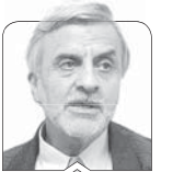
سیدمصطفی هاشمی طباطبائی

به مبارکی و میمنت، آفتاب مخفی نکه‌داشتن کمبود برق که دوش در چند سال گذشته به حلق کارخانجات تولیدی می‌رفت، متجلی شد و البته نوبدی است بر توفیق آنان که توسعه را مانع از ظهور حضرت (عج) می‌دانند و آنان که می‌گویند ما به هر قیمتی توسعه را انجام نمی‌دهیم. هرچند هر دو گروه اگرچه در لباس و قیافه و سوابق مختلف‌اند اما در یک امر دانسته و ندانسته شریک‌اند و آن هم واپس‌نگه‌داشتن کشور و افزایش فقر، هرچند شعار معیشت بهتر برای مردم را بدهند و حرف‌های خوشایند مردم به زبان بیاورند. شاید یکی از اینان بگوید کمبود برق چه ربطی به توسعه دارد و منظور از توسعه این نبوده، بلکه آن توسعه شیطانی و امپریالیستی و فراماسیونی بوده؛ حرف‌هایی که از روی نادانی و جهالت یا واپس‌گرایی زده می‌شود. امروز وقتی برق در کشور نباشد، تولیدات کارخانجات کم می‌شود و قفسه مغازه‌ها خالی، آب‌چاه‌های کشاورزی به کشاورزی نمی‌رسد و تولید کشاورزی کم می‌شود. نانوايي‌ها تعطيل می‌شود، امکان مطالعه کمتر می‌شود، سیستم‌های خدمات‌رسانی بانک‌ها و بیمارستان‌ها و فرودگاه‌ها و دیگر مراکز خدماتی از کار می‌افتد، غذاهای درون سردخانه‌ها، یخچال‌ها و فریزرها فاسد می‌شود و خلاصه تولید ناخالص ملی کاهش پیدا می‌کند و مردم هم از لحاظ مادی فقیر می‌شوند و هم از لحاظ رفتاری و معنوی.