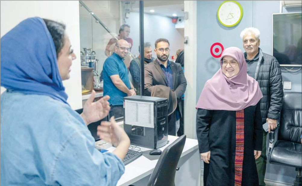
دکتر فاطمه مهاجرانی، سخنگوی دولت دیروز مهمان تحریریه شرق بود و در دیداری صمیمی با خبرنگاران در گفت‌وگویی به سوالات شرق در رابطه با شرایط سیاست داخلی و خارجی این روزهای ایران پاسخ داد و از آمیزش برای اعلام خبرهای خوب در آینده نزدیک گفت و تأکید داشت که دولت به دنبال کاهش تنش با جامعه جهانی است و مگاهای اساسی را با حفظ عزت، حکمت و مصلحت بر می‌دارد

مجازات اسلامی» در سال ۱۳۹۲ اعتبار داشت. در قانون جدید تغییراتی در جرائم جنسی مشاهده می‌شود، اما مجازات تجاوز جنسی بدون تغییر مانده است. ماده ۲۲۴ حد زنا را در چهار مورد مستحق اعدام می‌داند که یکی از موارد آن عبارت از است از «زنا به عُنف یا اگره از سوی زانی که موجب اعدام رانی است». مفهوم دیگر تجاوز به همسر یا «تجاوز زناشویی»، عمل جنسی مرد با همسر خود بدون رضایت اوست. از دهه ۹۰ میلادی به این سو در بسیاری از کشورهای اروپایی ازجمله فرانسه، آلمان و هلند این عمل جرم تلقی شد. در ایران با توجه به تعریف «قانون مجازات اسلامی» که ارتباط نامشروع را مشروط به نبود «علقه زوجیت» کرده، این موضوع اساسا منتفی است. فرایند دادخواهی به پرونده تجاوز این‌گونه است که به خاطر عدم ارتکاب تجاوز در انظار عمومی، به طور معمول شروع رسیدگی با شکایت قربانی آغاز می‌شود، اما به دلیل جنبه عمومی و اهمیت آن، ادامه تعقیب کیفری با دخالت دادستان است و با صرف گذشت شاکی دادرسی کیفری متوقف نمی‌شود. پس از طرح شکایت، پرونده به طور مستقیم در دادگاه مطرح می‌شود و مرحله تحقیقات مقدماتی را نیز دادگاه به جای دادسرا بر عهده می‌گیرد. به دلیل اهمیت جرم و شدت مجازات، «دادگاه کیفری یک» که با حضور سه قاضی در هر مرکز استان تشکیل می‌شود، به پرونده تجاوز جنسی رسیدگی خواهد کرد. نکته مهم