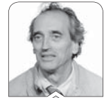
پروفیسور پل جوزفسون