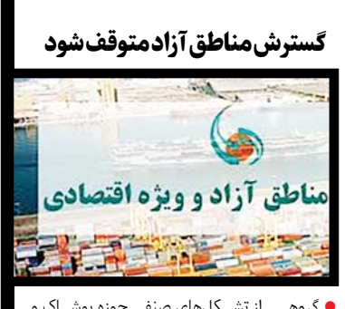
گسترش مناطق آزاد متوقف شود