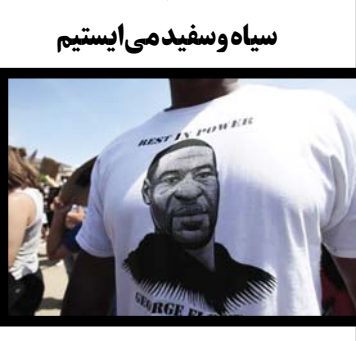
سیاه و سفید می ایستیم

● گروه مد، بخش بین الملل: نه تنها جوانان و نوجوانان آمریکایی، بلکه در بریتانیا نیز تی شرت‌های مزین به چهره جورج فلویید (George Floyd) که ۲۵ می در مینیاپولیس آمریکا توسط پلیس کشته شد، هواداران بسیاری پیدا کرده است. مرگ او سبب جنجال عظیمی در آمریکا شده و بیش از ۱۰ روز است که ناآرامی‌ها ادامه دارد. ووک بریتانیا (British Vogue) حامی معنوی و رسانه‌ای کمیته‌ی شده که پس از مرگ جورج فلویید برای تقویت جنبش ضد نژادپرستی و خشونت علیه سیاهان راه‌اندازی شده است. حرکت نمادین این مجله شهریه پوشش اخبار اعتراضات به صورت سیاه‌وسفید در تمام صفحات آنلاین این رسانه پرمخاطب جهانی است که می‌کوشد نوعی نگاه بشردوستانه و ضد خشونت به زندگی رنگین‌پوستان داشته باشد. علاوه بر حرکات نمادین در نوع و دیزاین پوشش خبری و انتشار اخبار، حمایت همه‌جانبه از کمیته «اگر تو سفیدپوست هستی و مخالف نژادپرستی هستی» (If You Are White & Anti-Racist Campaign) است. در این کمیته ۱۰ کام اساسی برای مبارزه با خشونت علیه سیاهان پیشنهاد شده است و به تمام کاربران فضای مجازی در سراسر دنیا آموزش می‌دهد که چگونه می‌توانند با پوستر به این کمیته از هرگونه اقدام علیه رنگین‌پوستان ممانعت به عمل بیاورند. مهم‌ترین گامی که در این کمیته آموزش داده شده، اجتناب از به اشتراک‌گذاری هرگونه محتوای ویدیویی یا عکس است که ممکن است رنگین‌پوستان از مشاهده آن در فضای اینترنت، دچار شرم یا خودشکنی شوند. همچنین گردانندگان کمیته توصیه کرده‌اند که هر کس در هر جایگاه اجتماعی که باشد می‌تواند حتی با جزئی‌ترین کمک مالی به صندوق‌های حامی