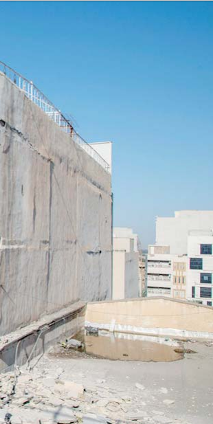
باعداد دوشنبه ساختمانی طبقه در منطقه زیتون‌کارمندی اهواز دچار ریزش شد. این حادثه فوتی یا مصدومی نداشت و خانه‌های اطراف آن برای رعایت اصول ایمنی تخلیه شده‌اند. در این حادثه یک بخش ۱۰ واحدی این ساختمان کاملا فرو ریخته و سازه بخش دیگر که نیم‌الدیاری دارد، برقرار بوده است.