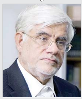
عارف در دیدار با همتایان پیشین خود

روایت عارف از دیدار با همتایان پیشین خود