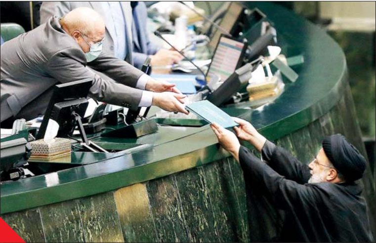
دو مرد در حال امضای قرارداد