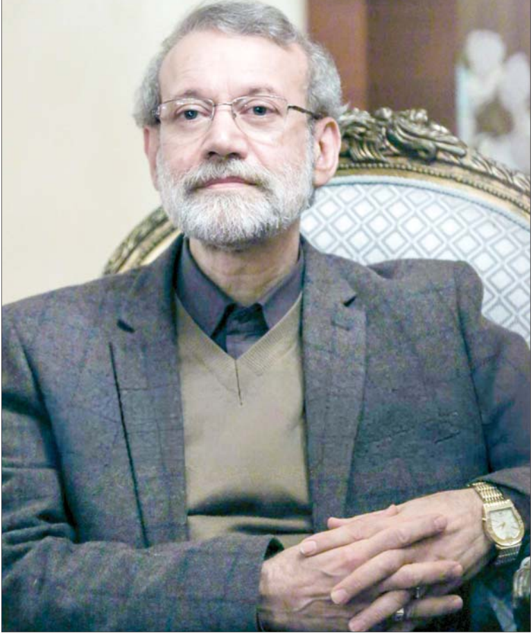
این گزارش را در صفحه ۲ بخوانید.

بهره‌گیری از تجربه‌هایی مانند دکتر لاریجانی، بهترین تصمیم در فضای فعلی کشور است