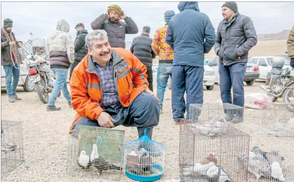
بازار فروش پرندگان بجنورد در جاده کشتارگاه صنعتی این شهرستان واقع شده است. این بازار هر جمعه مملو از جمعیتی است که برای خرید و فروش انواع پرندگان اهلی یا زینتی راهی بازار شده‌اند. همه با قفس یا کارتن‌های کوچک و بزرگ در آنجا حضور دارند تا پرندگان خود را به فروش برسانند.

چهارشنبه ۱ اسفند ۱۴۰۳ • ۲۰ شعبان ۱۴۴۶ • ۱۹ فوریه ۲۰۲۵ • سال بیست‌ویکم • شماره ۵۰۵۴ • ۱۲ صفحه اذان ظهر تهران ۱۲:۱۸ • اذان مغرب ۱۷:۰۵ • اذان صبح فردا ۵:۲۲ • طلوع آفتاب ۶:۴۶