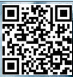
این گفت‌وگو را در صفحه ۶ بخوانید.