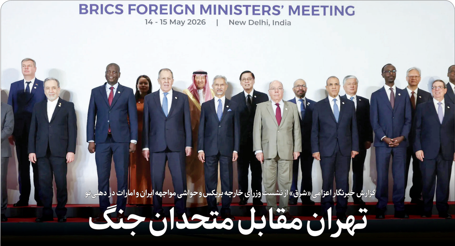
این گزارش را در صفحه ۲ بخوانید.کس، Reuters

گزارش خبرنگار اعزامی «شرق» از نشست وزرای خارجه بریکس و حواشی مواجهه ایران و امارات در دهلی نو