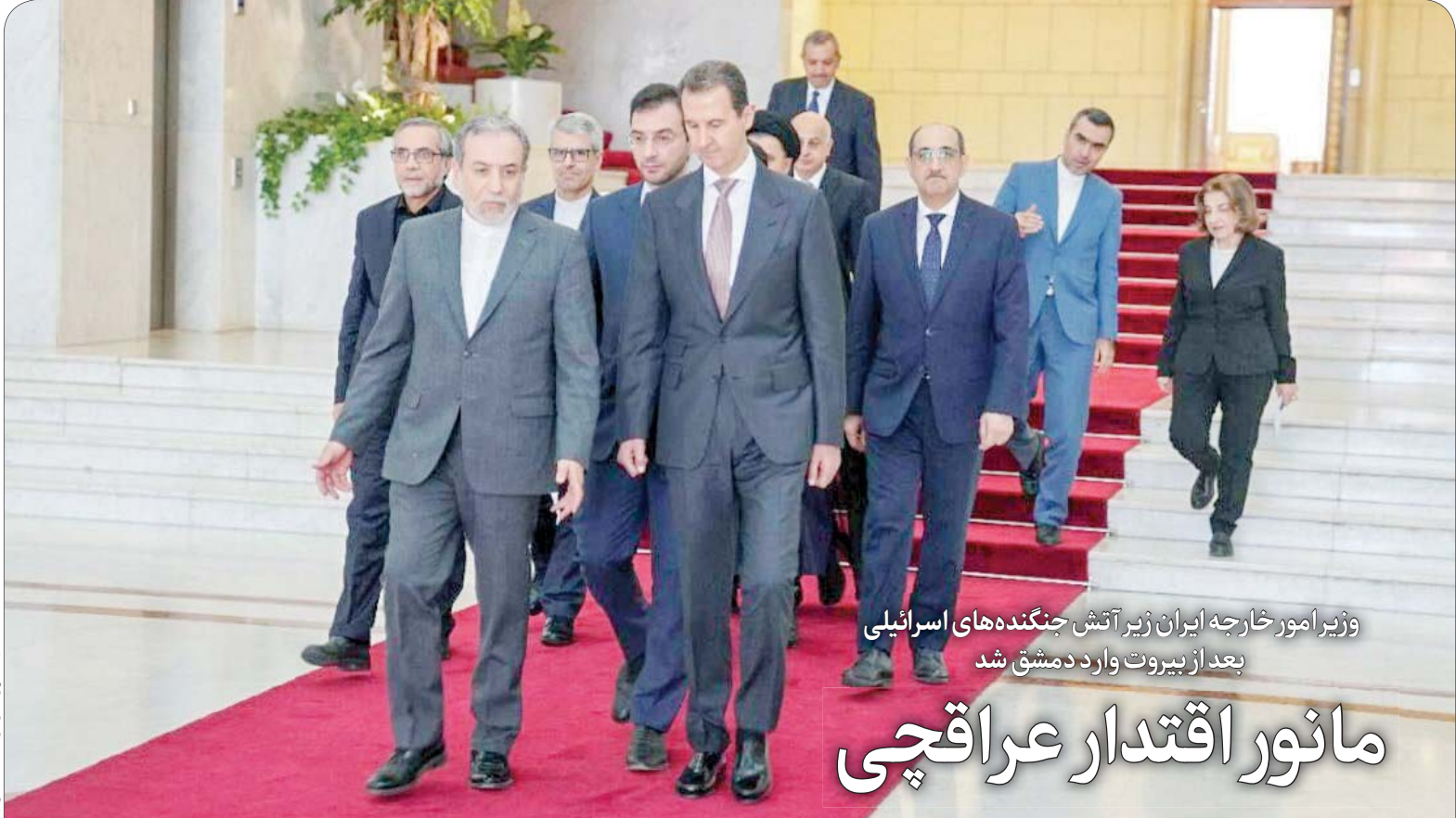
این گزارش را در صفحه ۳ بخوانید

وزیر امور خارجه ایران زیر آتش جنگنده‌های اسرائیلی بعد از بیروت وارد دمشق شد