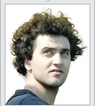
درگذشت داود احمدی‌مونس با نام هنری «آروین»، کارتون‌نویست