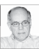
کوروش احمدی دیپلمات پیشین