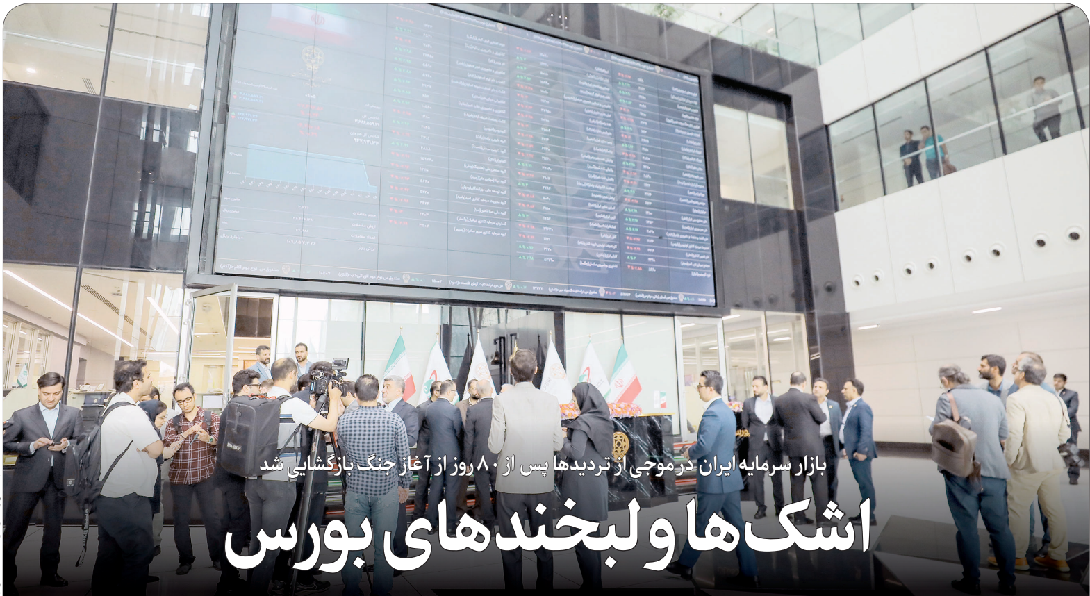
بازار سرمایه ایران در موجی از تردیدها پس از ۸۰ روز از آغاز جنگ با کشایی شد