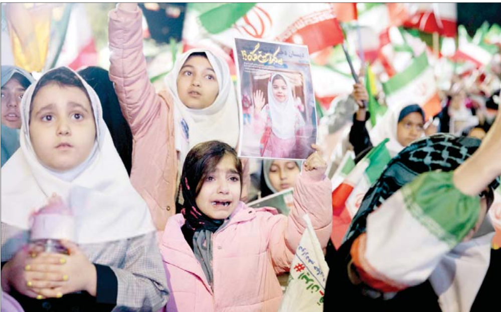
مراسم گرامیداشت چهارم شهادت دانش‌آموزان مدرسه میناب با حضور دانش‌آموزان سمنانی در سی‌وششمین «شب اقتدار» برگزار شد.

پنجشنبه ۲۰ فروردین ۱۴۰۵ • ۹ آوریل ۲۰۲۶ • ۲۰ شوال ۱۴۴۷ • سال بیست‌ودوم • شماره ۵۳۵۶ • صفحه ۸ اذان ظهر تهران ۱۲:۰۶ • اذان مغرب ۱۸:۵۱ • اذان صبح فردا ۰۴:۱۲ • طلوع آفتاب ۰۵:۳۹