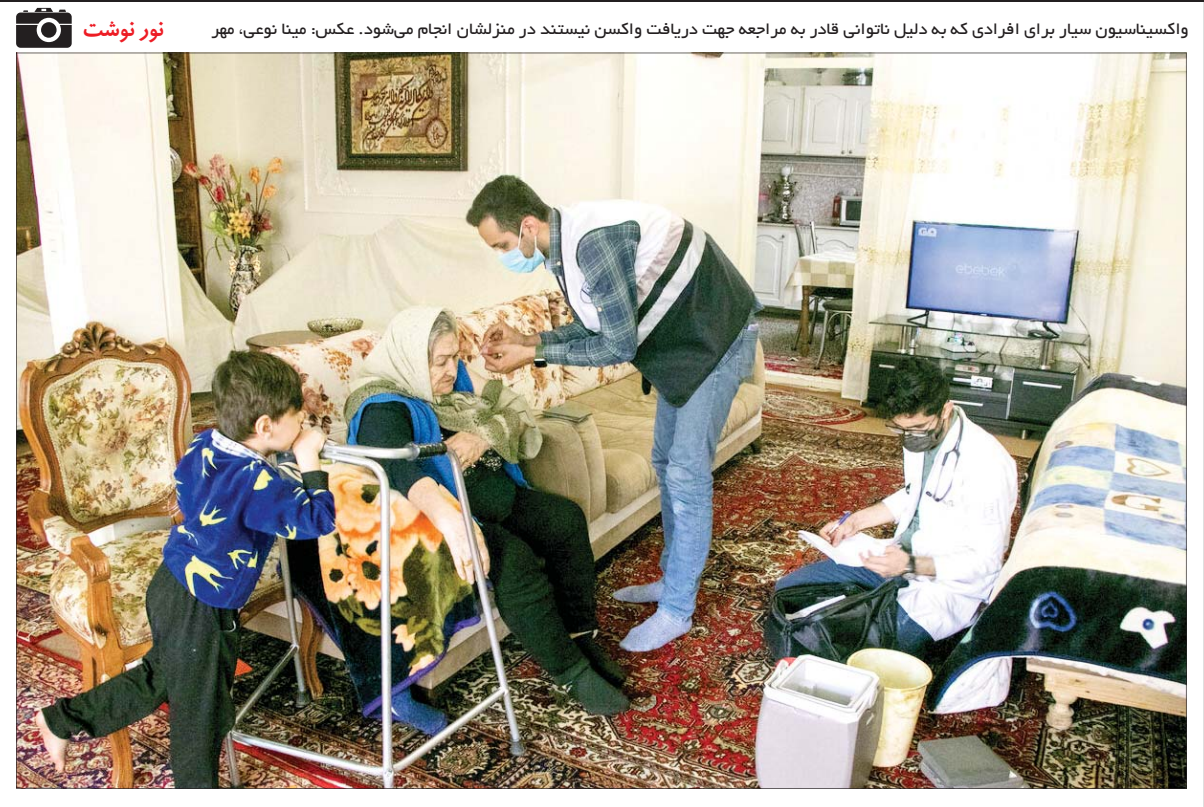
واکسیناسیون سیار برای افرادی که به دلیل ناتوانی قادر به مراجعه جهت دریافت واکسن نیستند در منزل نشان انجام می‌شود.