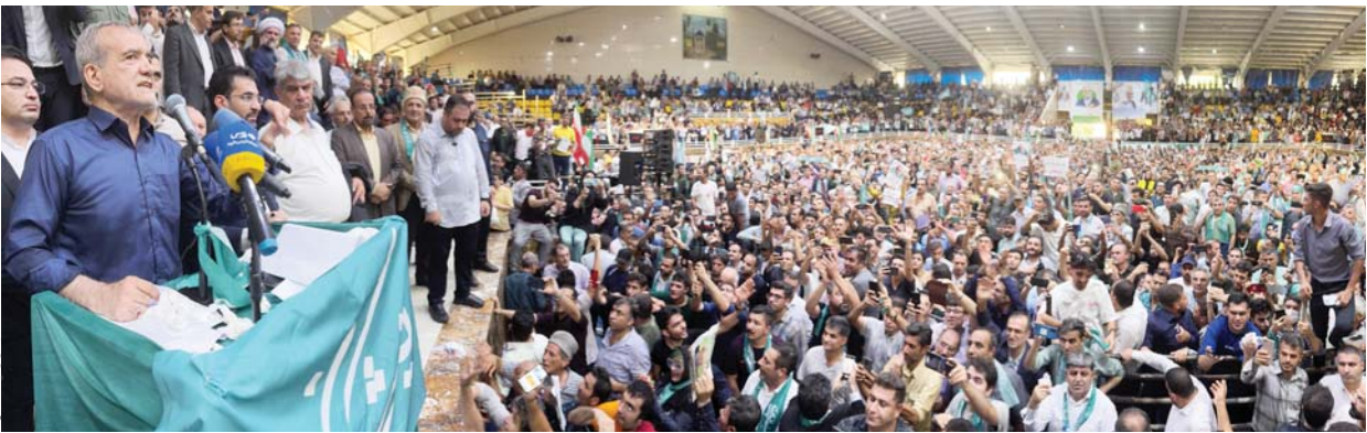
سخن سیدمحمد علیان در سخنرانی

سفرهای انتخاباتی مسعود پزشکیان با استقبال پرشور و بی نظیر مردم کردستان و شیراز به نقطه عطفی تبدیل شد