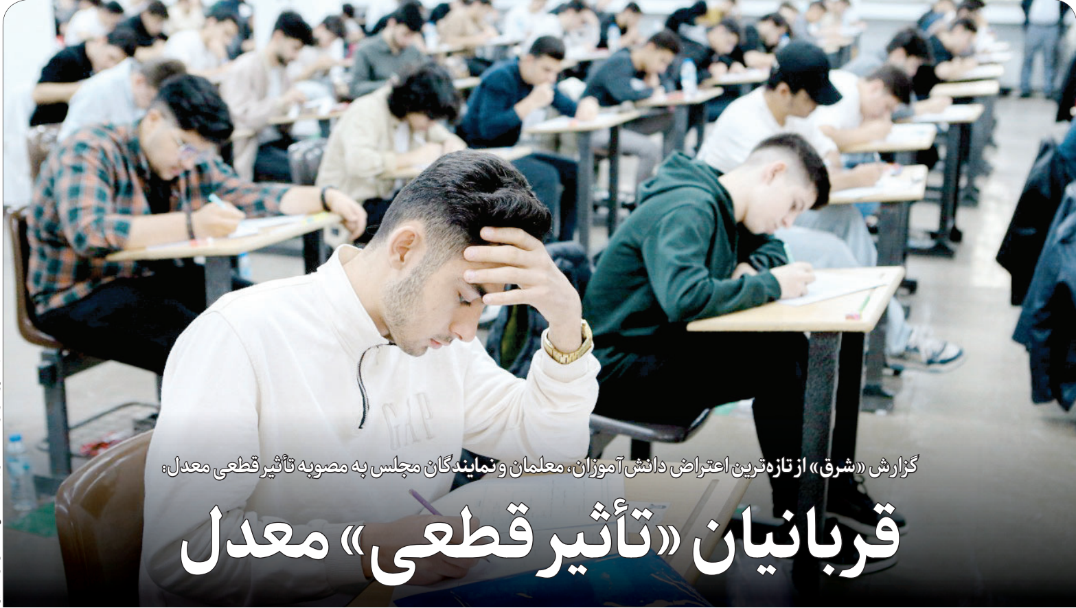
این گزارش را در صفحه ۷ بخوانید.

گزارش «شرق» از تازه‌ترین اعتراضات دانش‌آموزان، معلمان و نمایندگان مجلس به مصوبه تأثیر قطعی معدل: