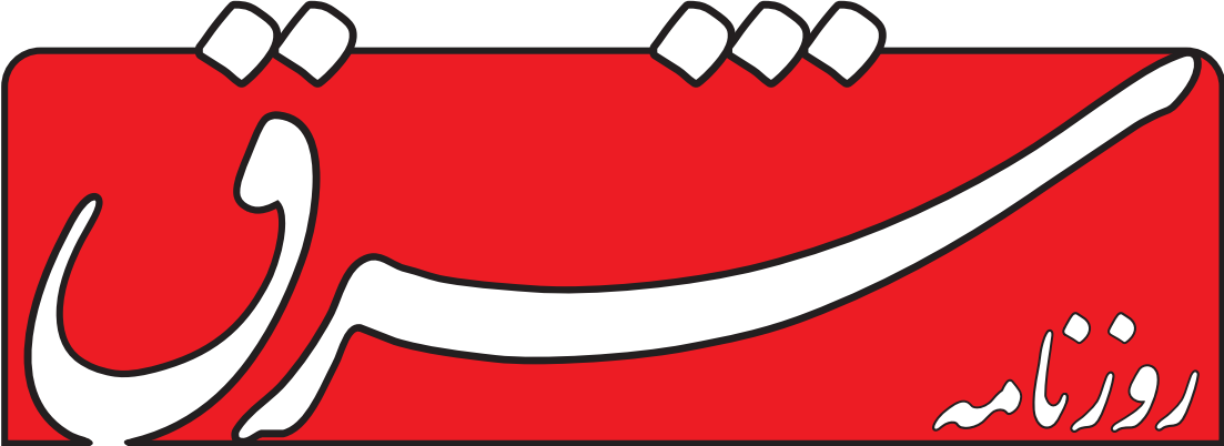
سه‌شنبه ۲۹ فروردین ۱۴۰۲ • ۲۷ رمضان ۱۴۴۴ • ۱۸ آوریل ۲۰۲۳ • سال بیستم • شماره ۴۵۲۳ • ۱۲ صفحه • ۱۵۰۰۰ تومان

نگاهی به تحرک تورم و ارزیابی عملکرد مدیریت اجرایی برای کنترل گرانی در گفت‌وگو با نمایندگان مجلس