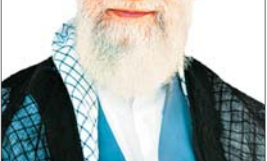
حجت‌الاسلام علی نوری، رئیس ستاد برگزاری نماز عید سعید