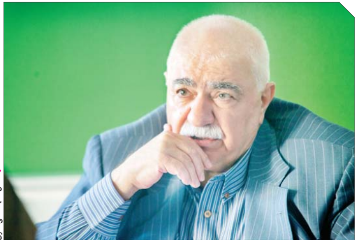
عکس: شهید باهنر

سید محمد بحرینیان از خسارت ۸۰۰۰ میلیاردی صنعت در خراسان رضوی به واسطه تکرار بحران برق و گاز برای بخش تولید می گوید