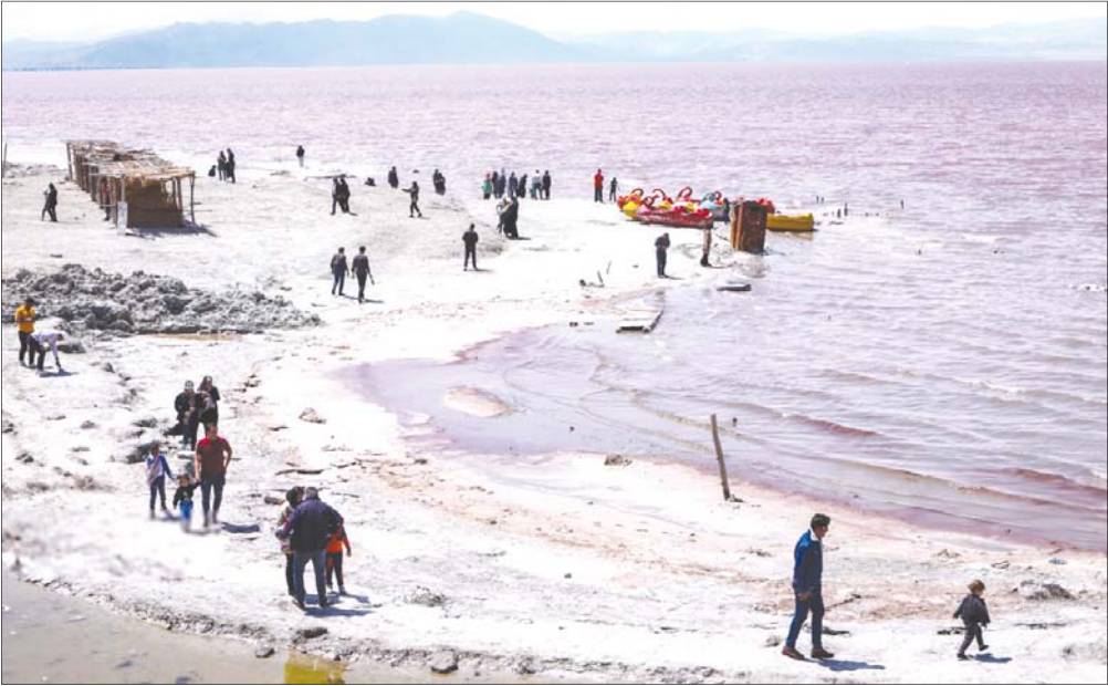
طبق اعلام دبیر کارگروه ملی نجات دریاچه ارومیه، با اقدامات انجام‌شده و باران‌های شدید و سیل‌آسای بهاری وسعت دریاچه ارومیه نسبت به مدت زمان مشابه سال قبل ۵۶۰ کیلومتر مربع افزایش یافته و حجم آب دریاچه نیز از ۶۰۰ میلیون مترمکعب افزایش نسبت به مدت مشابه سال قبل، به دو و نیم میلیارد مترمکعب رسیده است.