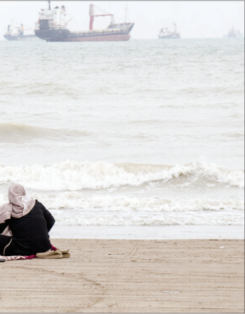
محله «سوره» یکی از قدیمی‌ترین محله‌های بندرعباس است که قدمت آن به چند قرن پیش و به دوره‌های صفویه و قاجاریه می‌رسد. شغل اصلی ساکنان سوره صیادی، ملوانی لنج‌سازی و تعمیر قایق‌های چوبی بوده و بخشی از مردم نیز در فروش و فرآوری ماهی، فعالیت‌های بندری، حمل‌ونقل دریایی و مشاغل مرتبط با بندر بندرعباس مشغول به کار هستند.