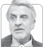
سیدمصطفی هاشمی طبا

چهاردهمین دوره انتخابات ریاست جمهوری اسلامی ایران نشان داد که برخلاف نظریه «مردم چه‌کاره‌اند»، مردم مصداق بیان امام راحل (ره) هستند که گفتند «مردم ولی‌نعمت ما هستند». اما این بیان به این معنا نیست که زمامداران به نام خدمت به مردم هرچه بخواهند، انجام دهند. آموزه‌های اسلامی که در رأس آن به‌کارگیری ایمان وعقل است، می‌آموزد که مدیریت در جامعه باید سرشار از عقل و درایت باشد و نه خوشامد گروهی یا گروه‌هایی و حتی بسیاری از افراد جامعه، زیرا جوامع باید به طریقی هدایت بشوند و از نظر فرهنگی تسلیح بشوند که آینده جامعه را به‌درستی تشخیص دهند و حق و مسئولیت را هم برای خود و هم برای حاکمان به‌درستی باور داشته باشند. به‌عنوان فردی که در حد خود از انتخاب رئیس‌جمهور منتخب حمایت کرده‌ام، ناچار می‌دانم متواضعانه به ایشان در این مرحله گذر نکاتی را تقدیم کنم.