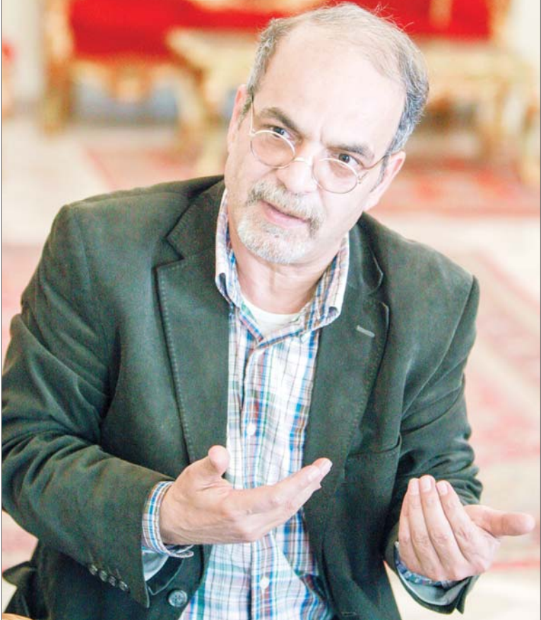
این گفت‌وگو را در صفحه ۲ بخوانید