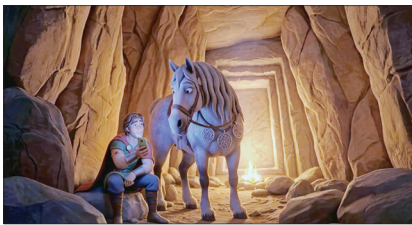
تهیه‌کننده، هایک سیمونیان راوی: خورن لووتیان مدیر صدا: داویت دانتیان مدیر هنری: آتوش قازاریان مدیر فیلمبرداری: واهگن تر-هاکویسیان سرپرست تولید هوش مصنوعی: لوسیس باغداساریان تهیه‌کنندگان اجرایی: هوانانس مارگاریان هرانت مارگاریان