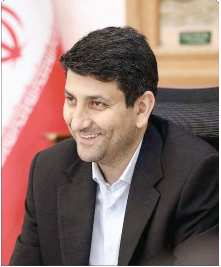
امیر امیرلو در صفحه ۶ بخوانید: تکس، سپیدتاپی و شرق

ضرورت حضور و نقش‌آفرینی مردم در عرصه‌های سیاست، اقتصاد، فرهنگ، جنگ و به‌طور کلی در تمام شئون اجتماعی، امری است که در نگاه نخست بدیهی و پذیرفته به نظر می‌رسد. مردم‌سالاری در حوزه حاکمیت، برای ذهن خردورز نه تنها پسندیده، بلکه شرط پایداری و سلامت اجتماع است. با این همه، تاریخ نشان می‌دهد که همین اصل روشن، در بسیاری از جوامع با موانع و اصطکاک‌هایی همراه بوده است. تقابل میان اراده عمومی و قدرت سیاسی‌ها که چنان شدت گرفته که به جنبش‌های گسترده و حتی جنگ‌های داخلی انجامیده است؛ چنان‌که در ایران عصر مشروطه، حرکت مردمی تیزباز فرماندهی ستارخان و باقرخان برای استقرار قانون‌خواهی و محدودکردن قدرت پادشاهی شکل گرفت.