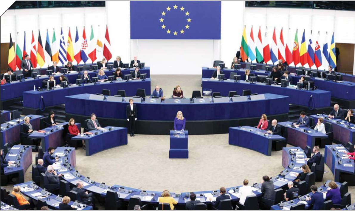
سفیر پیشین ایران در روسیه در جریان دیدار با نمایندگان پارلمان روسیه

◆ در راستای گفته‌های شما کنستانتین سیمونوف، مدیر صندوق امنیت ملی انرژی روسیه در گفت‌وگو با شبکه «راسیا 1» روسیه عنوان کرد: «ایران تحت تحریم‌ها باقی می‌ماند و این تحریم‌ها سخت‌تر نیز می‌شود؛ اگر بخواهم صادقانه بگویم، این خبر خوبی برای ماست.» آیا گفته کنستانتین سیمونوف موضع رسمی روسیه است یا واسیلی نبنزیا و دیمیتری پولیانسکی؟