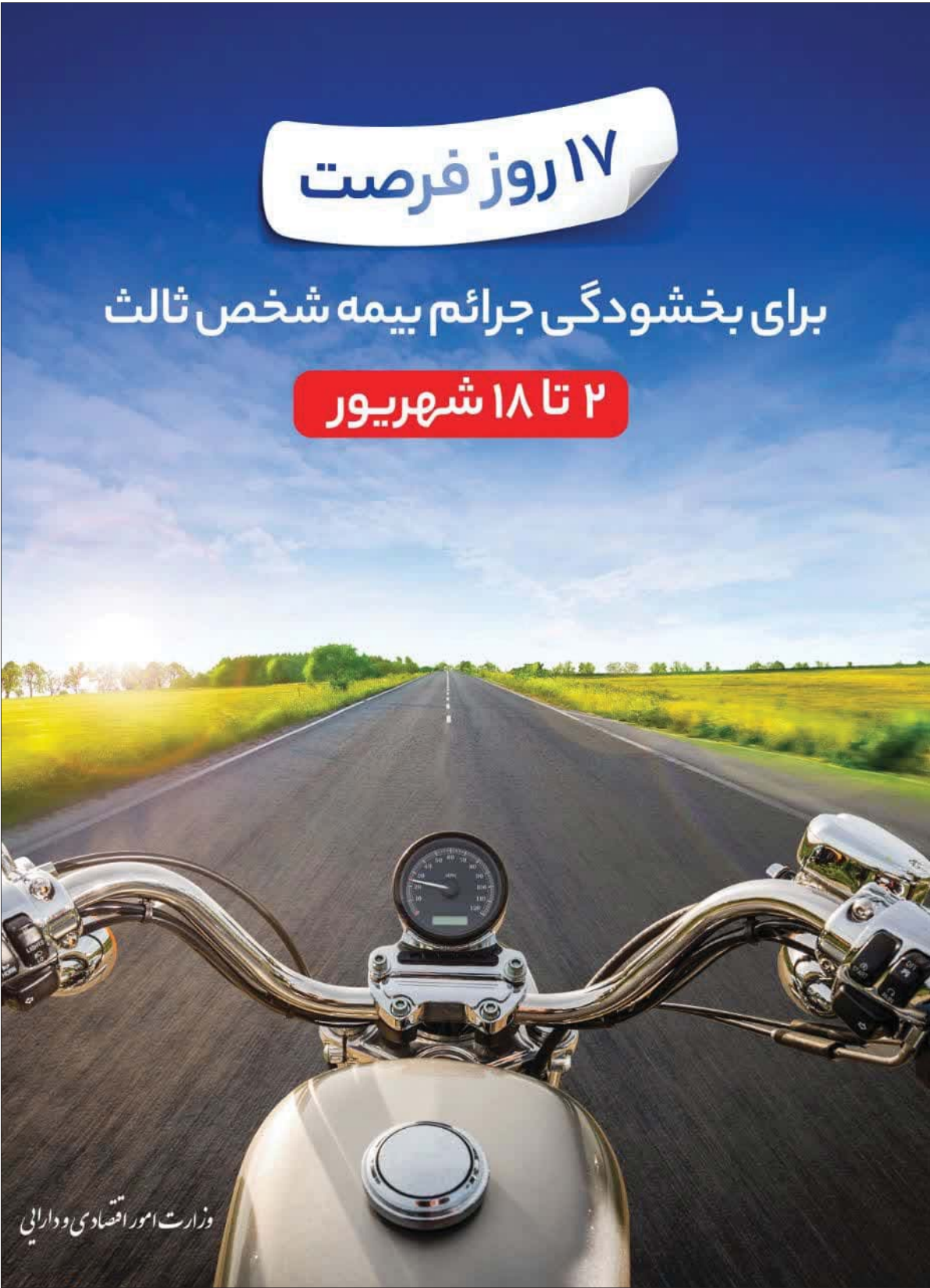
وزارت امور اقتصادی و دارایی

شهردار منطقه ۲۱ با بیان اینکه کودک اول برای برداشتن توپ به سمت فنیس رفته و کودک دوم نیز از فنیس می‌پرد و دچار حادثه می‌شود، می‌گوید: کودک سوم به خانواده خبر می‌دهد و با حضور اهالی و حاضران در بوستان با آتش‌نشانی تماس