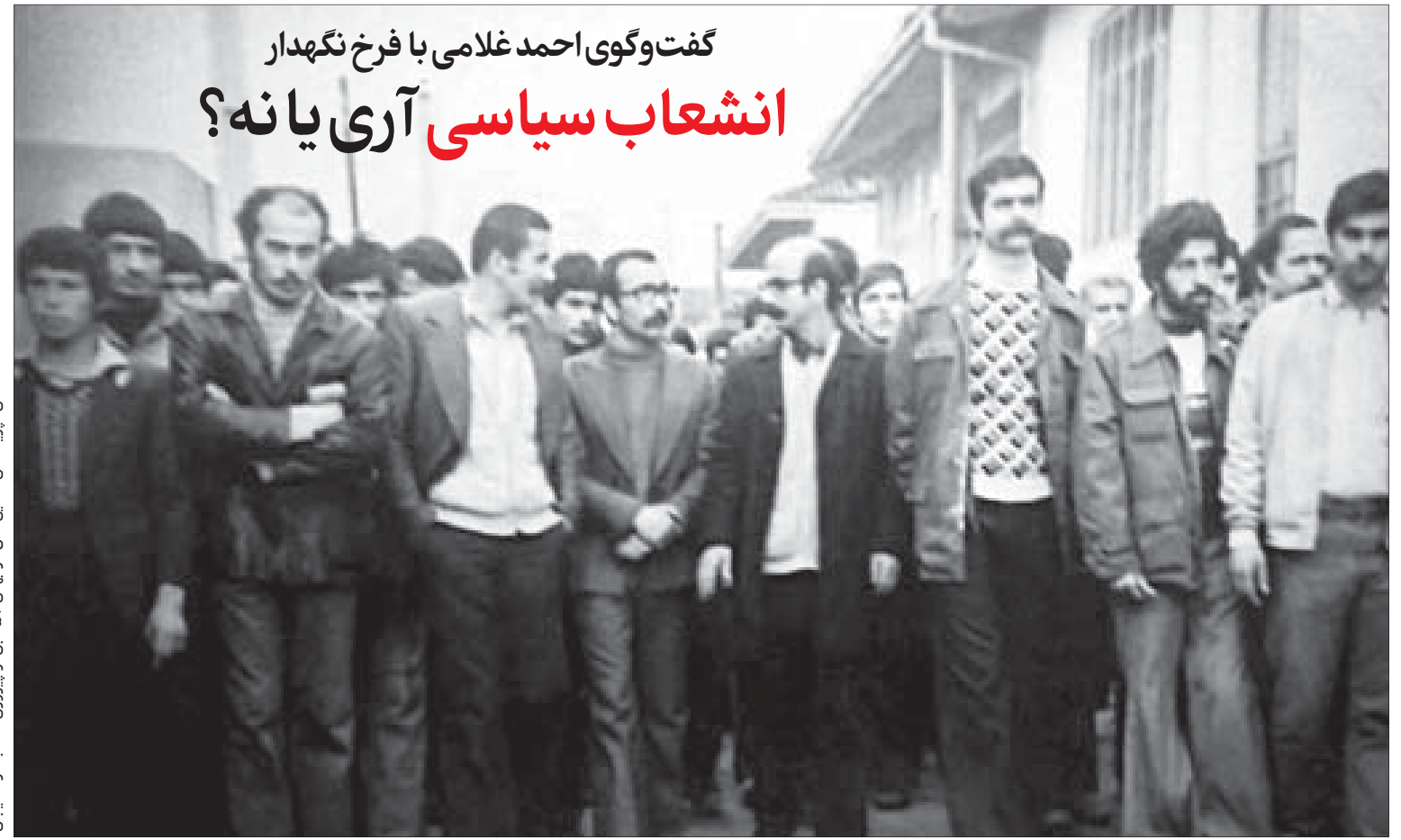
عکس: چریک‌های فدایی خلق در بهمن ۵۷ قبل از پیروزی انقلاب در لاهijan