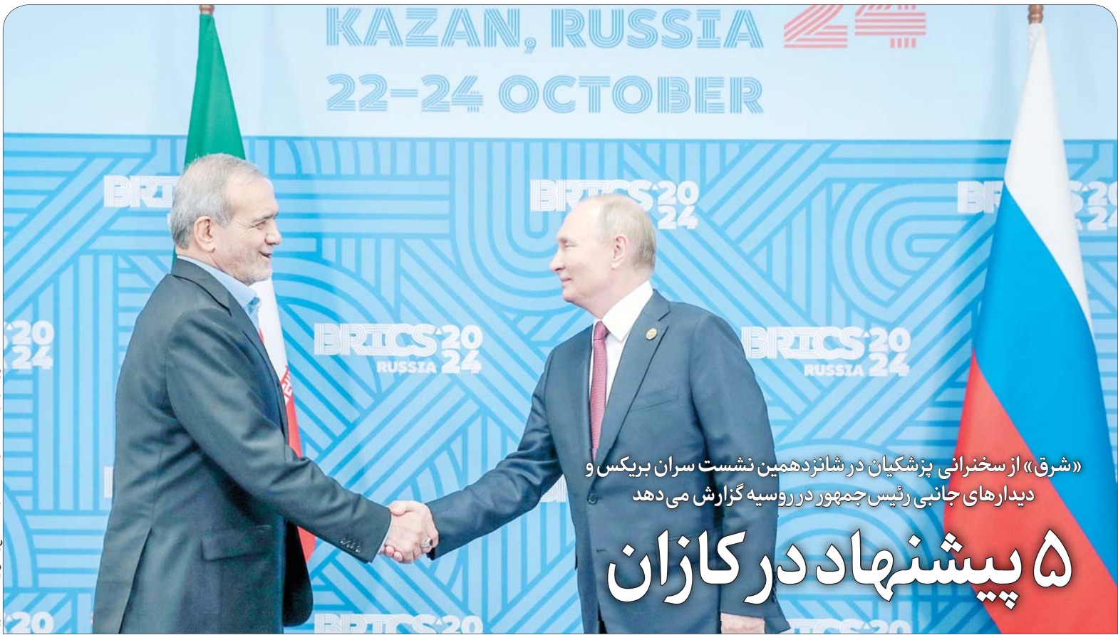
«شرق» از سخنرانی پزشک‌های در شانزدهمین نشست سران بریکس و دیدارهای جانبی رئیس‌جمهور در روسیه گزارش می‌دهد